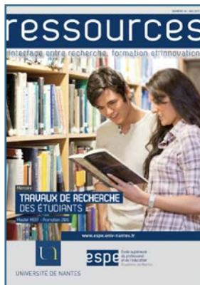
Travaux de recherche des étudiants de l'ESPE Session 2016

Cette revue interface entre recherche et innovation veut donner accès à la diversité d'approches scientifiques des recherches, des expérimentations menées en Inspé. Elle souhaite permettre aux chercheurs, formateurs, professionnels et étudiants de publier leurs travaux de recherche, d'innovation ou d'expérimentation.