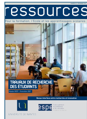
Travaux de recherche des étudiants de l'ESPE Décembre 2018