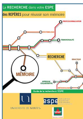
La recherche dans votre ESPE, des repères pour réussir son mémoire

Dans un format court et accessible, les livrets «Repères» exposent des connaissances et des réflexions sur des questions vives de la formation des enseignants. Les contributions de différents acteurs proposent trois types d'apports pour aider à se situer dans la formation : des repères sur les enjeux, des repères pour comprendre, des repères pour agir.