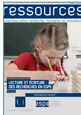
Lecture et écriture : des recherches en ESPE Avril 2018