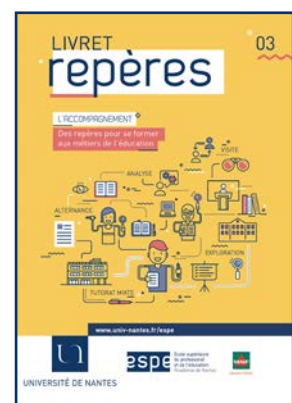
L'accompagnement, des repères pour se former aux métiers de l'éducation

L'ensemble de ces ouvrages est disponible en prêt dans les CRD des sites de formation et en version numérique sur :