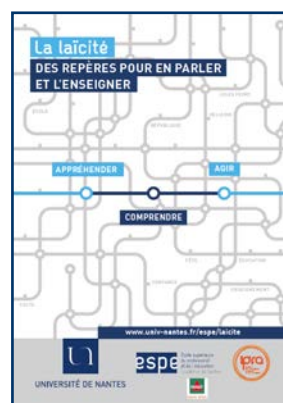
La laïcité, des repères pour en parler et l'enseigner